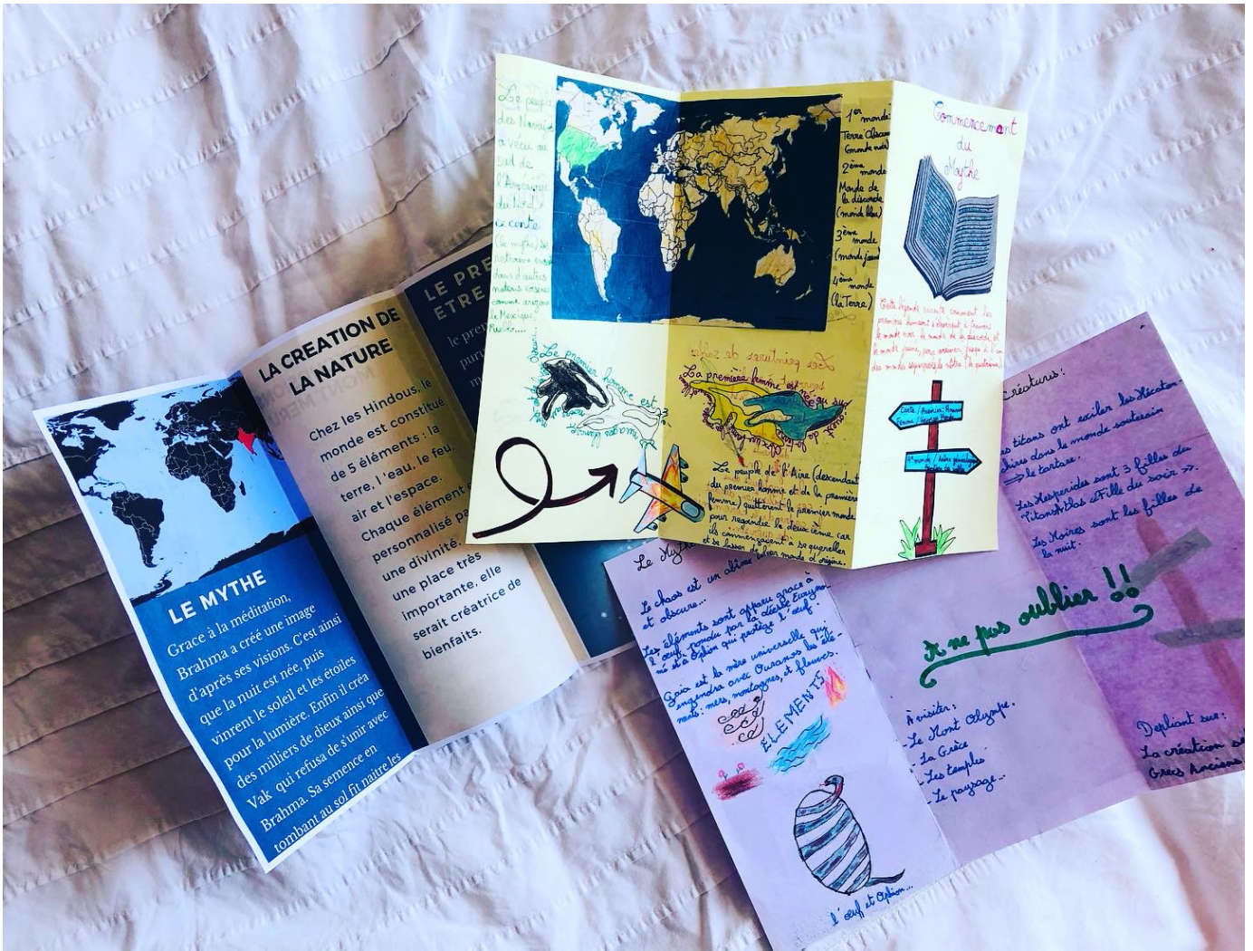
Carnet de lecture recueilli par Manon Varvier, « tour du monde des mythes », classe de 4e, Académie de Grenoble ©