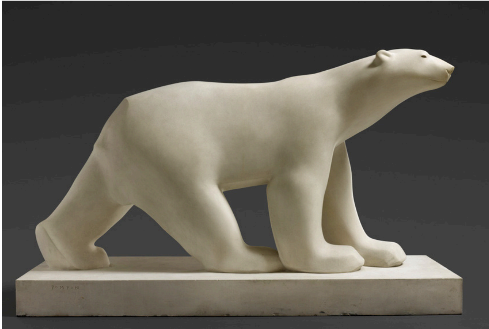
François POMPON, Ours blanc , entre 1923 et 1933, statue en pierre, H : 163 cm x L : 251 cm x l : 90 cm. Musée d'Orsay, Paris, France.