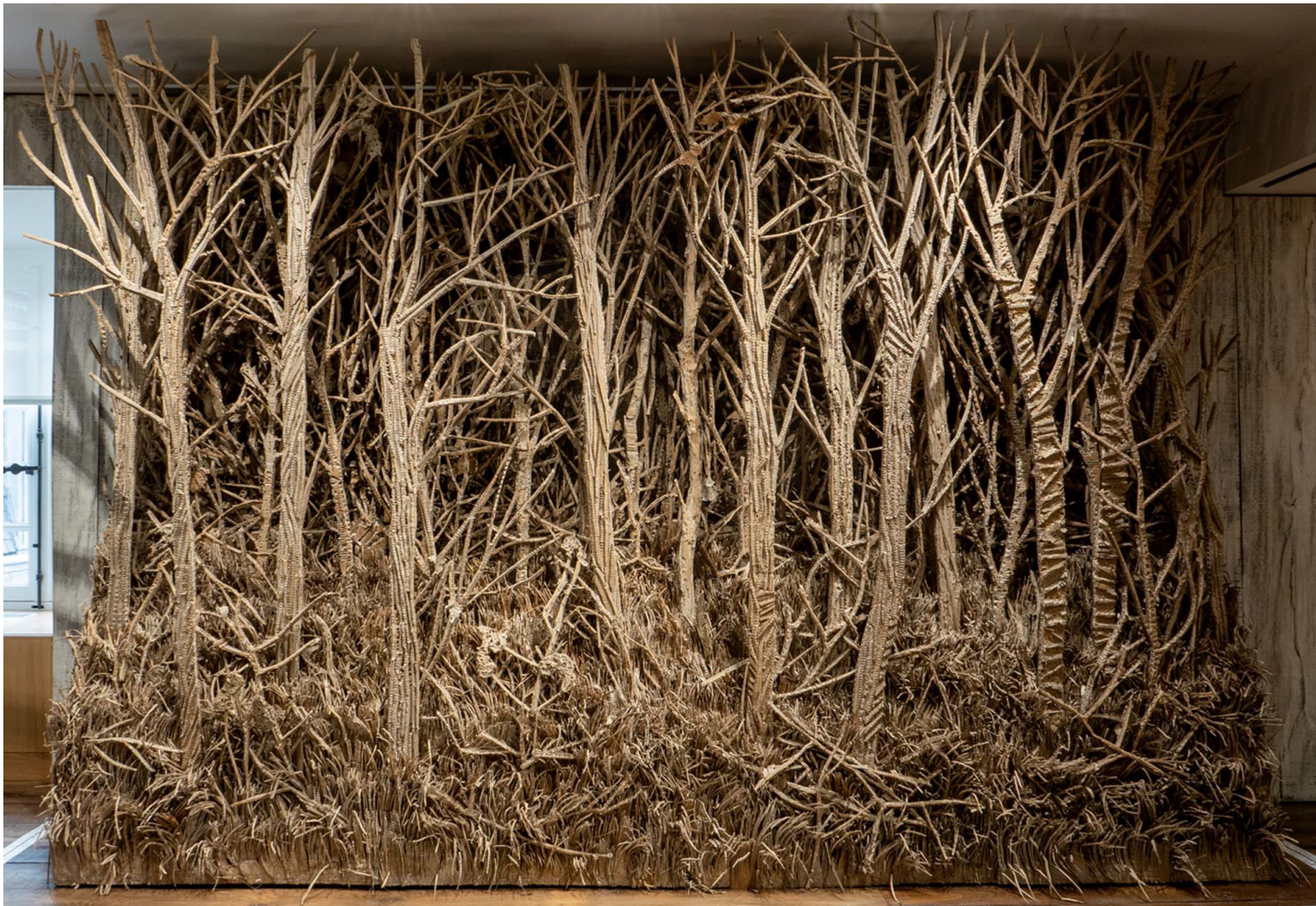
Eva JOSPIN, La Forêt , 2012, carton et bois, H : 2,50 m x L : 3,60 m x l : 0,17 m. Vue d'exposition du Musée de la Chasse et de la Nature, Paris, France.