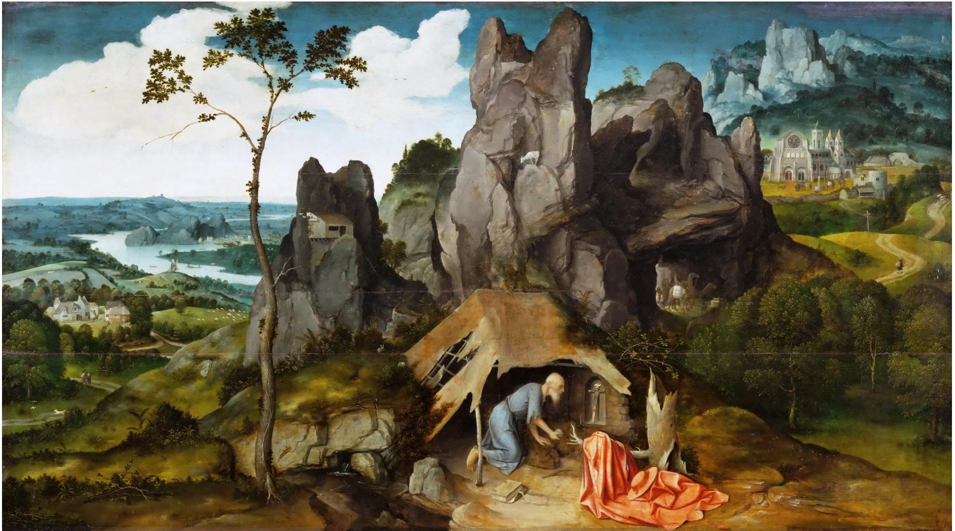
Joachim PATINIR, Saint Jérôme dans le désert, vers 1515-1520, huile sur panneau de bois, 78 x 137 cm. Musée du Louvre, Paris, France.