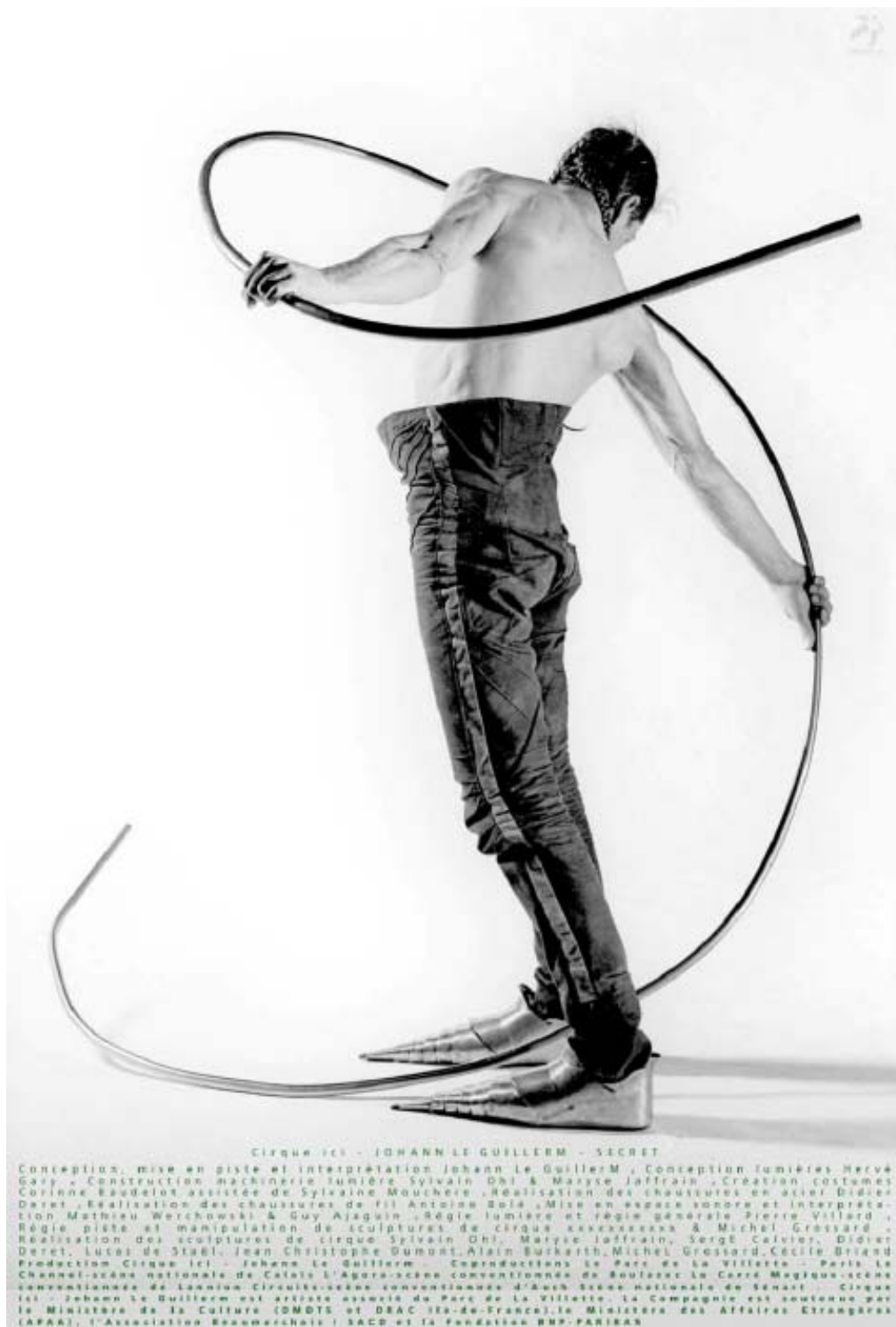
Marie-Agnès Revert (graphisme), Philippe Cibille (photographie), Affiche du spectacle Secret (épreuve), Johann Le Guillerm, « Attraction, espace des points de vue », Pièce (dé)montée : Attraction , SCÉRÉN-CRDP de l'académie de Paris, n°47, juin 2008, p.23.