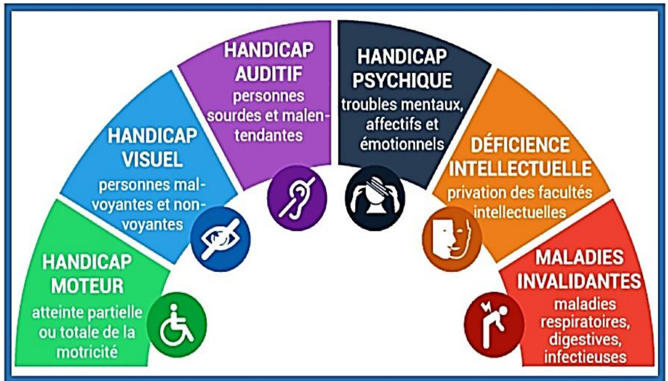
Les familles de handicap

L'inclusion est-elle possible pour tous ?