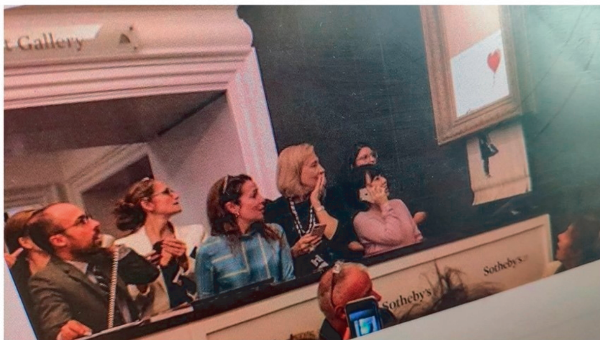
Image du compte Instagram de Banksy montrant la destruction d'une de ses oeuvres lors d'une vente aux enchères à Londres, le 5 octobre dernier.

CHRONIQUE. L'artiste Banksy a sans doute voulu dénoncer les excès de l'argent avec son tableau autodéchirant. C'est raté : ledit tableau vaut encore plus cher. Mais son message le plus important est ailleurs.