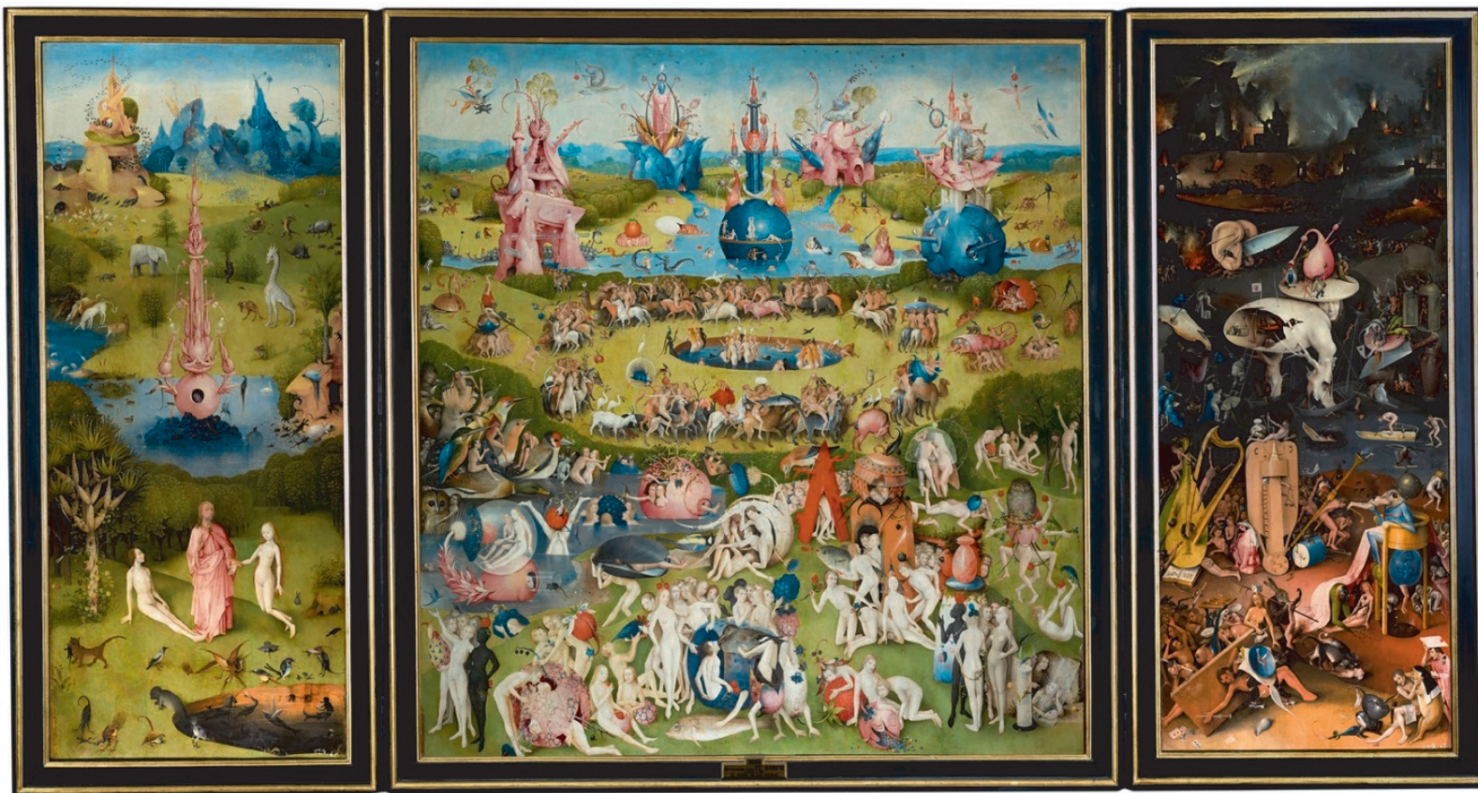
Jérôme BOSCH, Le Jardin des délices , 1494-1505, panneau central : 185,8 x 172,5 cm, panneaux latéraux : 185,5 x 76,5 cm chaque, huile sur bois. Musée du Prado, Madrid, Espagne.

Image supérieure : La Création du monde , triptyque fermé.