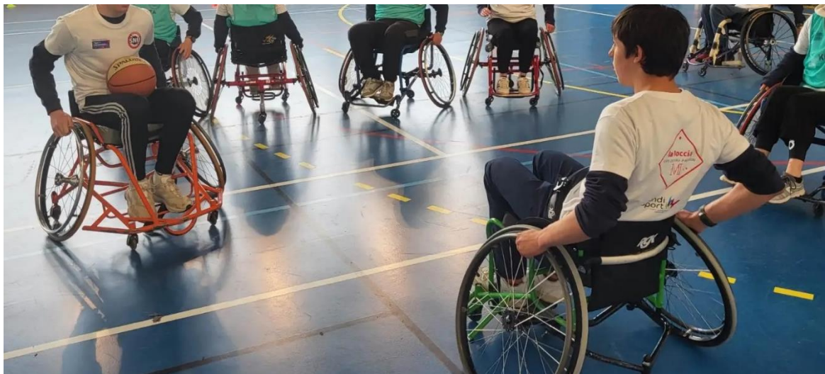
Activité basket-fauteuil, avril 2023, centre SNU de SOURS (28).