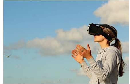
Métaverse