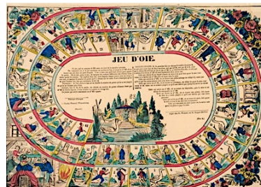
Jeu de l'oie, Wisseburg , CC BY-SA

La contribution de la philosophie à la dixième Lettre ÉduNum thématique sur la ludification dresse un bref état de l'art de cette notion, en la distinguant de celles de gamification et de ludicisation , qui relèvent d'approches ou de programmes de recherches différents. Les lecteurs intéressés trouveront dans la revue Sciences du jeu les derniers développements de recherche contemporaine sur le thème et peuvent aussi réécouter une série d'émission de France Culture consacrée à la philosophie du jeu vidéo. À quoi nos élèves joueront-ils dans le monde de demain ?