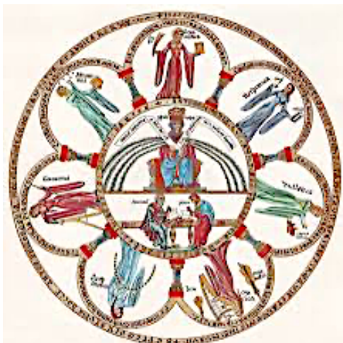
Les arts libéraux, Hortus deliciarum , CC BY-SA