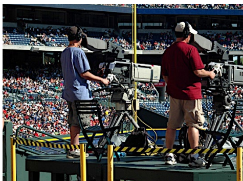
Jeu VR

Extrait : « Les philosophes s'intéressent au jeu. Héraclite (fr.52) ou Eugène Fink en firent par exemple un symbole du monde et Platon présentait déjà dans Parménide (137b) la