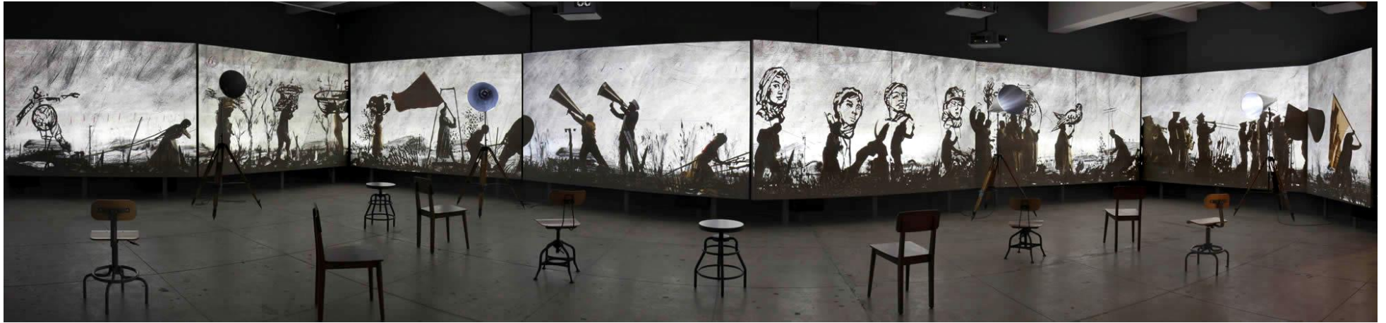
William KENTRIDGE, More Sweetly Play the Dance (Jouer la danse plus doucement) , 2015, dimensions variables, installation vidéo 8 canaux haute définition, 15 min, avec 4 porte-voix. Musée des beaux-arts du Canada, Ottawa, Canada. Vue d'installation à la galerie Marian Goodman, New York, 2016, États-Unis.