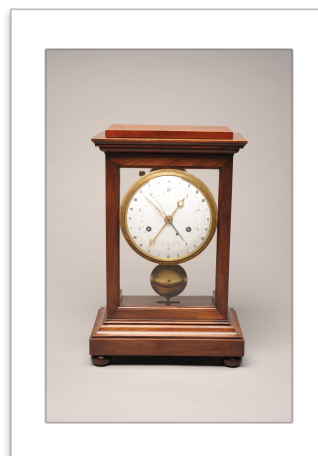
Pendule à temps décimal et sexagésimal, 1794 Inv. 14568

V- Enfin l'évocation de l'horlogerie à quartz et du temps atomique permet d'achever ce panorama de l'histoire de la mesure du temps par des considérations relatives aux enjeux contemporains.