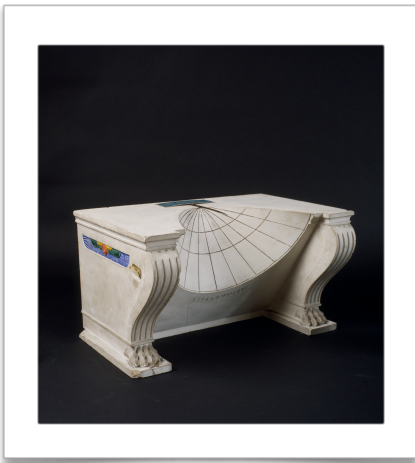
Reconstitution d'un cadran solaire conique phénicien, 1870 Inv. 09426

II- L'étude de l'évolution des cadrans solaires nous amène ensuite à comprendre la situation à laquelle conduit leur usage à la fin du 16 e siècle : une définition locale du temps, et des conventions très variables d'une région à l'autre.