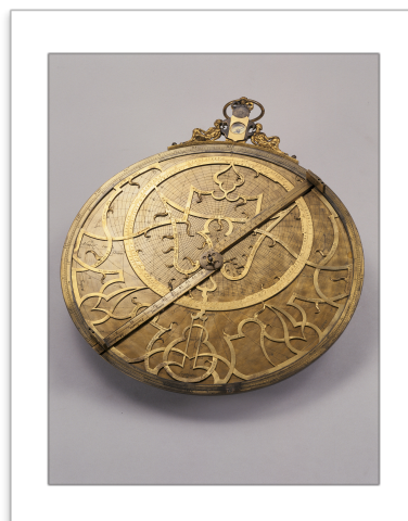
Astrolabe par Arsenius, 1569 Inv. 03907

III- La description du principe de l'astrolabe, perfectionné par les Arabes et diffusé en Europe à la fin du Moyen-Âge, est l'occasion d'aborder le passage des heures inégales aux heures égales.