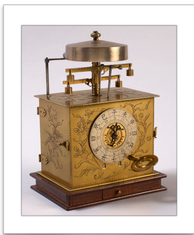
Pendule portative japonaise à heures inégales, 1775-1825 Inv. 22035

IV- L'étude de l'évolution de l'horlogerie mécanique prolonge cette réflexion et permet aussi d'évoquer l'unification de la mesure du temps à l'échelle nationale puis internationale entreprise à la fin du 19 e et au début du 20 e siècle.